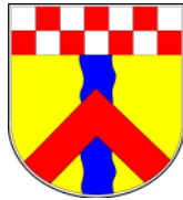
Stadt der Kluterthöhle Ennepetal