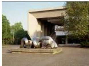
NATURMASCHINE, BRIGITTE UND MARTIN MATSCHINSKY-DENNINGHOFF, 1969