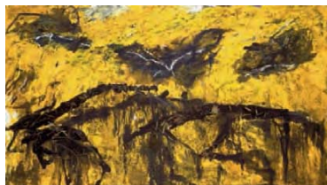
EMIL SCHUMACHER, PALMARUM, 1991