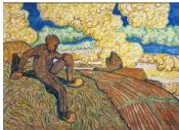
WILHELM MORGNER, DER MANN AUF DEM HÜGEL, 1911