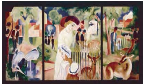
AUGUST MACKE, GROSSER ZOOLOGISCHER GARTEN, 1912