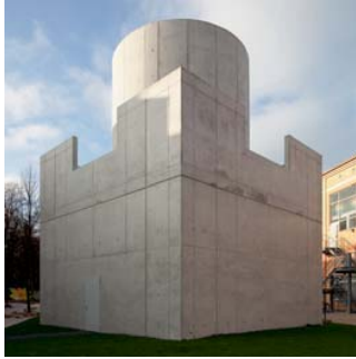
JAMES TURRELL, THIRD BREATH, 2009