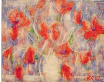
CHRISTIAN ROHLFS, MOHNBLUMEN, 1929